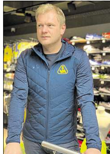
Hybrid-Jacke „Basti“ für 69,90 €

Softshell-Jacke ist in der warmen Jahreszeit perfekt für Sport- und Freizeitaktivität. Unser Ausstatter Erima hat hier wunderschöne Produkte zur