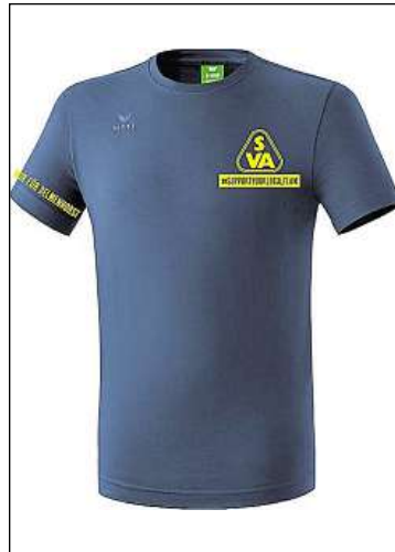
SV Atlas Supporter-Shirt für 15,- €

Das Support-Shirt enthält gestickte Logoapplikationen und ist für nur 15 Euro zu haben. Modisch überzeugt die absolut einmalige Hybrid-Jacke „Basti“. Das super bequeme und wärmende Modell ist ein sehr guter Begleiter – auch bei Wind und Wetter – und hält Stehkragen, Taschen und Kapuze bereit. Ebenfalls neu im Shop ist die Jacke „Manni“. Die leichte