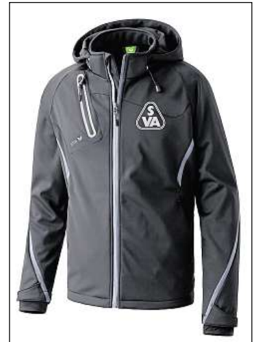
Softshell-Jacke „Manni“ für 109,90 €

Verfügung gestellt. Ihr könnt die Artikel bei Intersport Strudthoff in der Lange Straße kaufen oder bequem online unter svatlas-shop.de in den